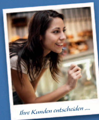
Ihre Kunden entscheiden ....

Auch bestens geeignet für den To-go-Verzehr.